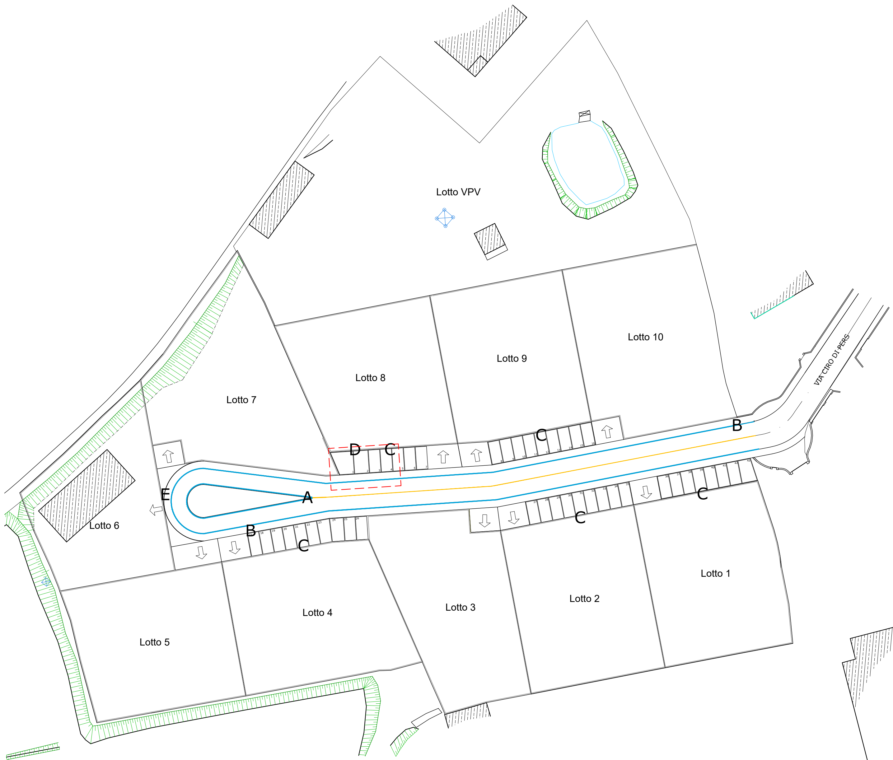
PLANIMETRIA P.A.C. "CIAMP DE LENC" CON INDICAZIONI SEGNALETICA STRADALE